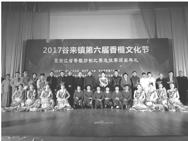
11 月 30 日,第六届香榧文化节在谷来镇举行。

省级香榧森林公园建设,以及 7.7 公里的健身步道工程;重点保护性修复古道 2 公里,启动建设袁郭岭游客接待中心;建设环会稽山国家森林公园美丽公路(嵊州段)。办好第六届香榧文化节暨九大系列活动,因地制宜发展民宿经济,重点宣传和培育袁郭岭村、勤勇村两个村的民宿,发展袁郭岭民宿 11 家,床位 77 张,打造集度假旅游、休闲观光、民俗文化为一体的旅游业态。