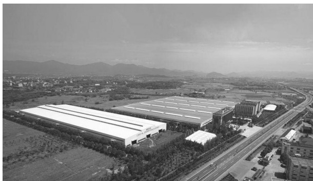
嵊州省级高新技术产业园区俯瞰图

【产业转型升级】 实施转型升级“七化”(领带服饰定制化、厨电产品品牌化、机械电机高端化、土地利用集约化、企业资产资本化、产品销售多元化、科技创新成果产业化)行动和实体经济培育工程,扶大育强机械链轮、电器厨具、茶叶加工等主导产业。实施 5000 万元以上新开工项目 6 只,捷尔世阻燃、湃肽生物、路宝佳建材等一批重点工业项目相继完工投产,艾迈塑胶、咸亨酱园等一批重点工业项目相继完成厂房建设。全年完成在建厂房面积 14.6 万平方米;完成个转企 16 家,小升规 8 家,企改股 2 家,新增省级科技型企业 11 家。引进海外英才人才 1 人,硕士及副高以上 5 名,湃肽生物入选市第一届“剡溪英才创新创业大赛”创业人才项目,获得专项资金 100 万元。推进行业整治,不断优化产业结构,全年关停淘汰落后产能企业 6 家,整治“低小散差”企业(作坊)26 家,全面办结中央环保督察信访交办件。