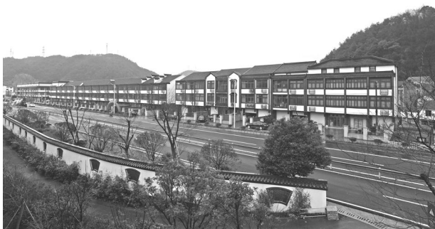
小城镇环境综合整治后的 104 国道

【城镇建设】 开展小城镇环境综合整治，项目总投资 9497 万，包含环境卫生整治、管线改造、沿路沿线建筑立面提升、景观绿化打造等 10 个大项目的小城镇环境综合整治工程紧扣时间节点要求，全面推进。全域推进“五星·3A”争创，“五星达标”实现 100%全覆盖。打造了“唐诗之路寻踪风景线”，建成全市首条红十字“博爱示范带”，成功创建绍兴市语言文字规范化乡镇，开展文明集镇创建。