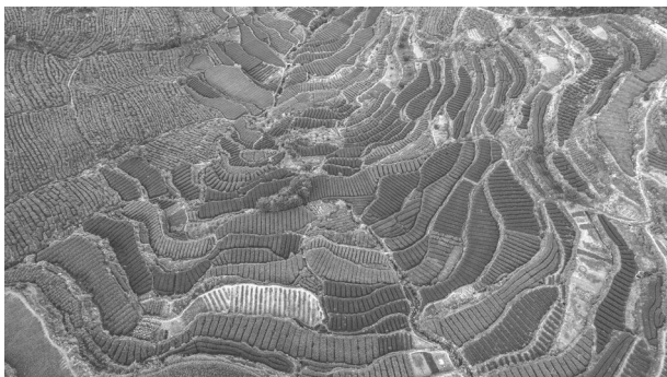
贵门乡茶园俯瞰图

【旅游基础设施】 充分用好贵门丰富的山水资源、深厚的人文底蕴,把发展生态旅游作为一个重要的群众增收点来抓。推进农家乐、民宿特色村发展运作,扶持有条件的村发展民宿,鼓励发展精品民宿,全乡已有民宿床位 60 张,今年新增 52 张,民宿收入达 40 万元;启动百亩花海、茶园绿道等项目,完成贵门村至庵晖亭的生态游步道项目、旅客指示牌等一批设施建设,加强与中美院合作,建立教授工作室,开展旅游推荐专场活动,加快