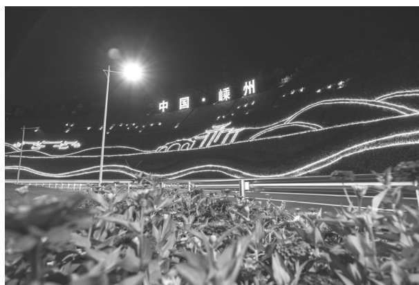
城北入城口改造项目——高速入口景观夜景

【亮点项目】 投资16.47亿元,实施城北入城口改造。嵊州大道高速入口至嵊州宾馆路段的立面改造、综合管线改造、景观绿化、景观亮化等工程