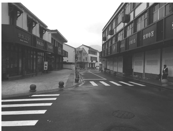
环境整治后的王院乡一角。

美丽乡村建设,累计投资 3000 余万元,围绕重点区域整治提升,推进攻坚项目。美丽城镇形象初显,并顺利通过省级验收,成功创建为绍兴市卫生乡镇。王院村丰竹线两路两侧的“蜘蛛网”(线乱拉)消失了,抬头便是蓝天;泥泞不堪、蜿蜒曲折的村后街变宽敞整洁了,打开车门就能进家门;沿江步道的建成,老百姓的获得感进一步提升;村前广场、村中公园的建设,植入了党建“黄”元素,强化了村级服务阵地;沿街沿路的绿化、美化、亮化,提升了王院百姓的幸福指数。加大农村环境卫生整治力度,石山屏村、丰田岭村、培坑村成功创建为环境整治示范村;完善“河长制”长效机制,全面完成剿劣任务,完成小微水体治理改善水环境,加强小舜江源头保护,实施常态化保洁管理制度;全面打赢农村旱厕歼灭战,垃圾分类工作全覆盖,农村面源污染得到有效控制。