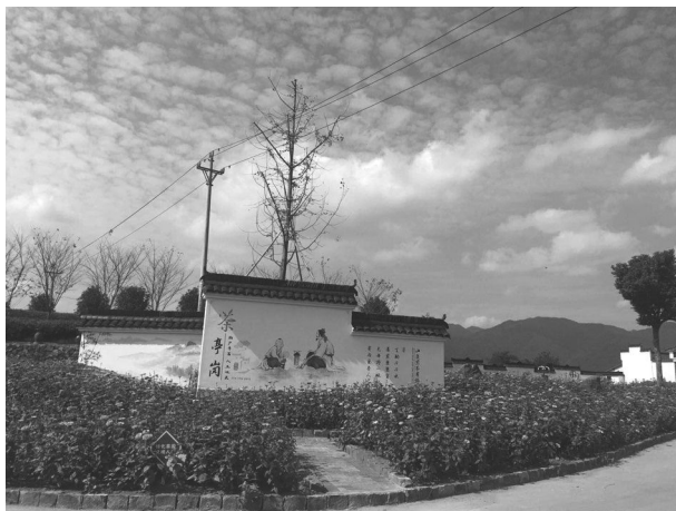
崇仁镇茶亭岗村一角

大。推进治水剿劣,59个Ⅳ类及以下小微水体整治点完成治理,14家留存生猪养殖场完成清养关停。启动全镇污泥浊水大整治行动、剿灭劣Ⅴ类水歼灭战,完成清淤总量8万立方,安装维护河长制公示牌152块、入河排污口标识520个、湖长制公示牌68块,被评为绍兴市“五水共治、重构重建”工作先进集体。农村旱厕全面消除。顺利通过中央环保督察,15件信访交办件全部办结。全年投入资金6768万元,顺利启动小城镇环境综合整治。全镇农村生活污水治理终端运维顺利移交,东西街综合整治工程完成施工设计,4.4公里绍甘线(崇仁段)强弱电入地改造快速推进,崇仁江综合治理工程集镇段1.7公里江道绿化工程启动,镇南大道入口公园建设有序推进,古镇入口景观初见形象。全年下发拆除通知书205份,及时核查处置新增违建20处,实现违法建筑拆除量同比增长105%,基本实现有违必拆。完成农房登记发证283户,受理私人建房用地规划和土地审批206户,有效破解农村建设监管缺位难题,权证改革平稳推进。成功创建环境整治示范村19个,其中精品村2个、优秀村1个;创建省级文明村1个、市级越剧文化示范村1个。