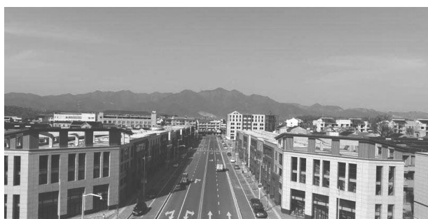
改造后的黄泽街景。

“双整”为目标,以景区化理念高起点、高标准编制建设规划,因地制宜设计村庄布局,突出党建引领,以变化见成效,重点打造美丽入村口、党群服务中心、村庄记忆节点、精品线路等。恒路村创建成为国家绿色村庄;家园村结合“民情墙弄”的特色做法,打响基层党建品牌;1938年就成立党支部的兰洲村,将红色元素与各个节点的布置进行巧妙结合,打造“红色堡垒”“红色记忆”“红色传承”。第一批13个村的“五星达标、3A争创”工作全面铺开,村庄面貌焕然一新,群众获得感明显提升。