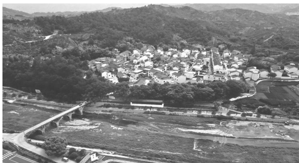
浙江首批 3A 级景区村庄——金兰村。

升改造、三线入地、江滨路建设、下溪线集镇段提升改造、商业街提升改造等项目陆续开工建设,综合性文化服务中心项目正在开展前期工作。全面推进集镇环境整治,加大拆清建力度,“三位一体”停车场等设施建成投用。持续推进“三改一拆”,开展旱厕专项整治,绍兴市无违建乡镇创建通过验收。小柏等 5 个村通过市环境整治示范村考评验收,董坞岗村被列为精品村,金兰村被列为首批省 3A 级景区创建村,绍兴市党建现场会在我镇召开。深入推进“五水共治”,完成疑似劣 V 类水体、畜禽养殖场整治任务,金兰村水质断面自动监测站和 PM2.5 空气自动监测站建成投运。制定下发农村环境卫生长效管理若干政策意见,建立健全长效管理机制,有序推进农村生活垃圾分类工作,成功创建嵊州市文明镇。