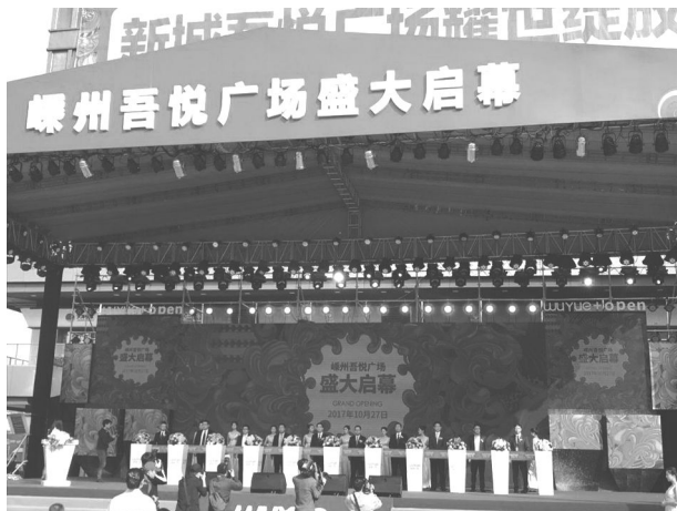
10月27日,嵊州吾悦广场盛大开业。

【概况】 位于市区南部,与新昌县接壤,面积 28.62 平方公里。辖 3 个工作片、8 个行政村、7 个社区。户籍人口 13404 户、37839 人。全年实现地区生产总值 103 亿元,增长 14%;财政总收入 4.5 亿元,一般公共预算收入 2.68 亿元,同比分别增长 12%和 15%;规上工业总产值 48.94 亿元,同比增长 16.4%;固定资产投资 23.15 亿元,同比增长 14.8%;工业性投资 16.38 亿元,同比增长 11.6%;基础设施投资 5.19 亿元,同比增长 26.7%;限上商贸销售额 23.6 亿元,同比增长 12.5%;限上社会消费品零售额 18.4 亿元,同比增长 14.4%。