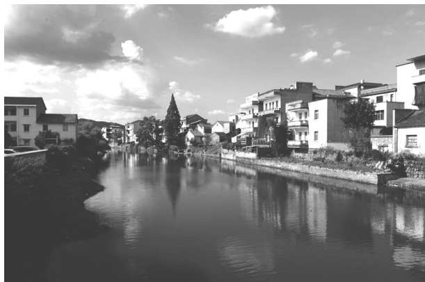
整治后清澈的石璜江

【民生事业】 集镇和村级污水管网工程基本完工,全镇范围内实现雨污分流。投资600多万元的石璜敬老院建设工程基本完成前期工作,计划增设50个床位,提升养老保障能力。投资1.5亿元的石璜江综合治理工程一期二标段已动工建设,通