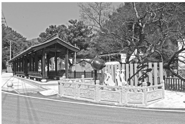
环境卫生整治后的通源乡一角

亭、西白步道等党建节点22个。白雁坑村完成省级美丽宜居示范村建设,西三村完成嵊州市环境卫生整治精品村创建,吴联村完成嵊州市环境卫生整治示范村创建。