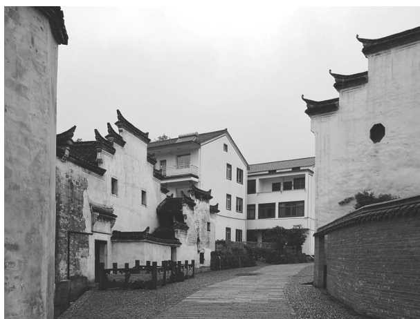
小城镇环境综合整治后的竹溪村一角

(竹溪村段)提升、小舜江周边整治、线乱拉整治等建设项目,“钱氏古村、舜江源头、质朴竹溪”的目标已初步实现。实施省级历史文化村保护利用项目,因地制宜抓好古村台门修缮工程,对旗杆台门等8个台门进行了修缮和复原,进一步恢复了古村面貌。实施舜源村环境整治示范村和盛家坞村环境整治精品村创建工作,村庄面貌得到了很大地提升。开展“五水共治”工作,对主要河道实施“三清”工程,完成小微水体整治提升工作,持续有力的抓好河长制的落实,小舜江水质长期达到Ⅱ类水标准。完善农村生活垃圾处理长效机制,实施垃圾分类工作,建立“户投、村集、乡运”的保洁模式,投入20余万元完善环卫设备。推进“三改一拆”、“农房确权登记”等工作,确保无违建乡镇创建成果,全年累计拆除一户多宅和危旧房17339平方米,拆后利用率92.23%,完成市2017年全年任务数的170%,其中非法一户多宅50多处,处置“裁执分离”案件任务1件,完成沿路沿线整治19处。