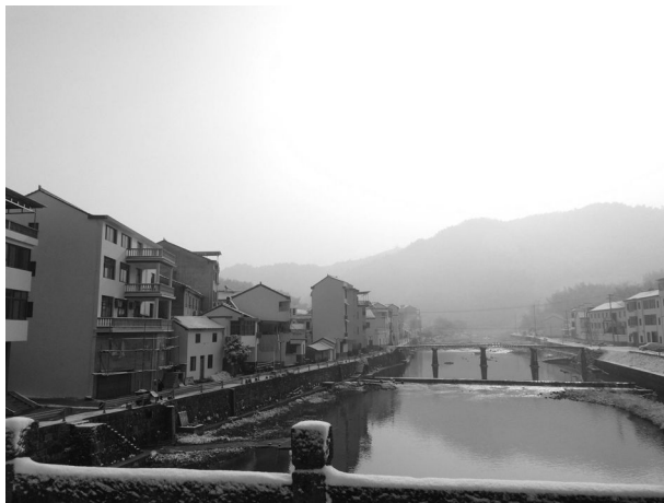
十八都江两侧立面改造。

【惠民实事工程】 下王镇加油站 5 月投入使用,结束了下王无加油站的历史。完成清淤 3 万方及 3 个“治水点”的治水任务,2 个河道交接断面全年总体水质保持Ⅱ类,6 个村的饮用水安全工程完工并通过验收;集中整治旱厕 1857 只,新建公厕 44 只,旱改水 35 只;完善垃圾清运制度,把所有自然村纳入垃圾清运范围,完成 12 个行政村垃圾分类试点,新增 2 处垃圾分类减量化资源化终端设施,在全市环境卫生 6 次专项检查中,下王镇 4 次位于同层面首位;全年累计拆除建筑面积 8.5 万平方米,其中危旧房面积 2.6 万平方米,农房登记发证工作在高彦岭村启动后,全市第一本不动产权证在下王镇发出,全镇已联审 500 多户,出具确认决定书 450 份,发放不动产权证 275 本;覆盖 19 个村的农村集体“三资”管理规范提升年活动顺利完成,累计化解历史积案 48 件,涉及金额 38.9 万元。