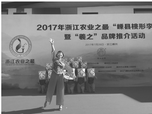
7月28日,浙江农业之最“嵊县桃形李”擂台赛暨“羲之”品牌推介活动现场。

【农业经济】 打造微商电商平台,开展首届桃形李采摘新闻发布会、2017 年浙江农业之最“嵊县桃形李”擂台赛暨“羲之”品牌推介等活动,今年桃形李销售额增长 30%以上。全年完成粮食播种面积 5975 亩,完成全年计划的 110.6%;农村居民人