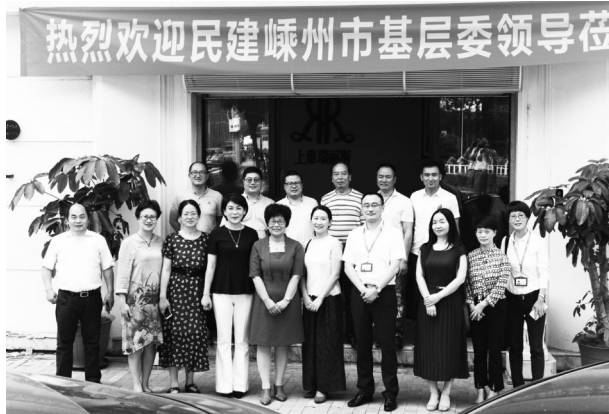
6 月 26 日,民建嵊州基层委员会与民建温州市鹿城区基层委员会开展工作交流。

履职能力,发挥民主党派作用”和“大数据环境下的税务风险防控”的专题讲座等。第五支部与绍兴新华支部开展结对活动,发挥双方支部的自身优势,增强支部建设统筹发展的内在动力和实际效果。