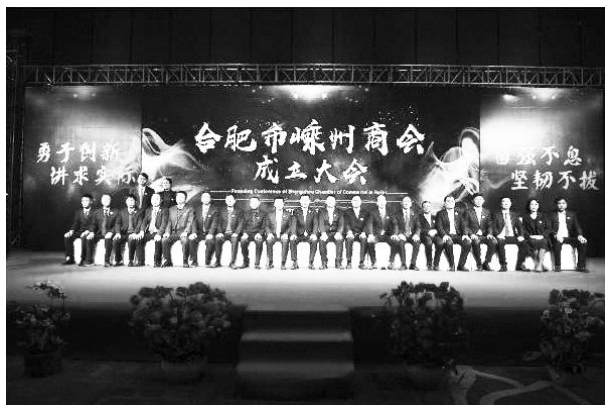
11月18日,合肥市嵊州商会成立大会在合肥万达文华饭店举行。

年度市工业企业30强企业作为兼职副主席(副会长),优化了班子结构,更好地发挥企业家作用。注重加强与市委人才办沟通联系,关心新生代企业家,特别是创二代企业家队伍建设,促进企业可持续发展。二是加强商会工作队伍建设。一方面,规范乡镇基层商会队伍。根据乡镇领导调整,重新明确乡镇基层商会领导班子。8月份,组织召开13家乡镇基层商会和3家行业商会的半年度工作例会,建立总商会与乡镇基层商会、行业商会交流会商制度,将乡镇工业线日常工作紧密结合起来,更好地服务于企业、服务于经济。另一方面,大力推动商会发展。新成立2个商会组织:商贸服务业商会“嵊州市家居建材装饰商会”和1家异地商会“合肥市嵊州商会”。(吕决胜)