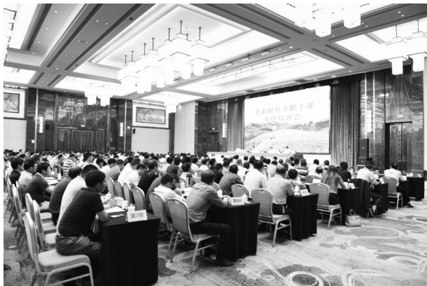
5 月 15 日,全市村、社区主职干部在嵊州宾馆集中培训。

【市村换届】 按照正风肃纪要求精心筹备两会,选举产生 24 名市人大、政府、政协领导班子成员及监察委员会主任、法检“两长”,55 名市人大、