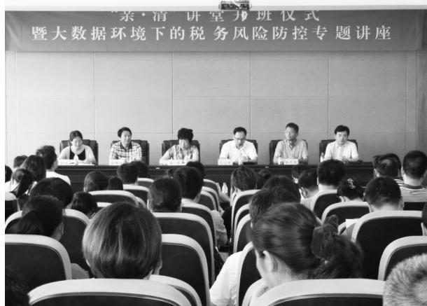
7 月 18 日,市委统战部在市委党校举办“亲·清”讲堂,即大数据环境下的税务风险防控专题讲座。

【统战大讲堂】 创设“统战干部讲堂”学习品牌,即每季一主题、一重点、一培训的“三个一”统战委员季度工作例会,建立健全统战工作定期交流机制;同时推进部机关学习规范化建设,做好书面通知、学习提纲、学习签到、学习记录和个人学习笔记本的落实,实行痕迹化管理,夯实基层统战工作基