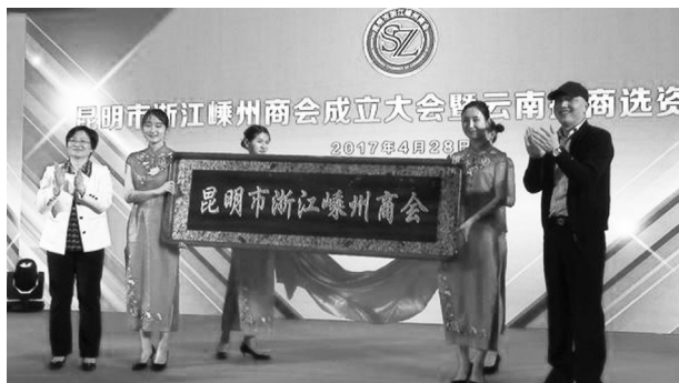
4 月 28 日,在昆明市成立昆明市浙江嵊州商会。

【聚商会商亲商】 加大异地商会建设步伐,2017 年新组建成立昆明市浙江嵊州商会和合肥市嵊州商会,在原有 5 家嵊籍异地商会的基础上增加 2 家。制订完善异地商会工作交流机制,组织召开两次全国嵊籍异地商会座谈会,建立商会行政人员 QQ 群,有效凝聚商会资源。加强工商联队伍建设,增补 30 强企业为工商联副会长单位,探索建立“政府—商会—企业”三方互动机制,广泛凝聚广大在外嵊州人,动员在外乡贤(嵊商)回乡投资建设。开设“亲·清”讲堂,开展针对性培训,定制个性化服务,助力非公企业“爬坡越坎”,打造“亲·清”政商关系“嵊州品牌”。为“30 强 30 优企业、国家高新技术企业、省级研发中心”等 89 家企业制作《嵊州市重点科技型企业名片》,打造宣传嵊州企业的“金名册”。加强新生代企业家培养引领,组织 35 名新生代企业家参加“传承·创新”培训班、《2017 年智能制造与产融结合专题研讨班》、EMBA 核心课程精修班(复旦班),通过与清华、浙大、复旦等知名高校的对接,帮助他们了解政策走向、解决发展难题、提