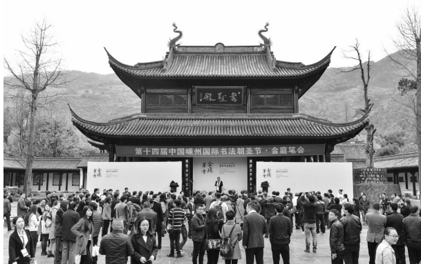
3月31日,第十四届中国嵊州国际书法朝圣节金庭笔会盛况。

公司、嵊州市人民政府联合主办的第十四届中国嵊州国际书法朝圣节在金庭镇王羲之故居旅游区拉开帷幕。参加此次节会活动的特邀来宾有132人,其中书法家25人,上海、杭州、宁波三地的旅行社45家,新华网、中国网、中国旅游报等新闻界来宾45人左右。在朝圣仪式中,与会领导、各界嘉宾于书圣墓前观看庄严而肃穆的民间祭祖活动,各界代表向书圣敬献花篮并弯身行礼。在金庭笔会中,来自全国的25位书法家在书圣殿两侧的长廊里挥毫泼墨,用书写咏刻唐诗这一特殊的方式向书圣致敬,并借此良机交流书学。“春游嵊州”系列活动启动仪式在国际会展中心举行,在国际会展中心二楼举办了三大书法展,集中展出第七届中国书协行书委员会委员、历届中国书法兰亭奖获奖者、历届“兰亭七子”的书法作品。此次系列活动还包括4月份即将举行的全省小学生游学嵊州、首届村嫂志愿文