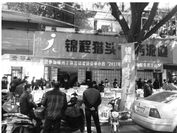
3月4日,在锦程人才市场举办招聘会。

【“就业再就业服务周”活动】 3月,市市场监管局联合市民个协组织开展“2017年就业再就业服务周活动”,为人才市场供需双方搭建平台。共有120家企业进场招聘,提供就业岗位800多个,接待应聘人员3800多人,达成初步就业意向近2000人。呈现的就业特点为:一是中小企业参与热情高。以商贸、服务类为主的中小企业占本次招聘企业的60%以上,其中有90%以上的中小企业表示每年都会来参加招聘会。二是应聘人员素质高。当年应届、往届大学毕业生占成功应聘人员的45%,企业员工的新生力量在不断充实,素质在不断提高。三是薪酬福利待遇高。企业的普工月薪普遍在3000元左右,较往年提高300元,技术类月薪