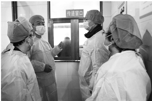
1月6日,国务院食安办等6部门督查崇仁镇富润学校食堂及周边食品安全。

边食品安全工作进行联合督查。督查组一行针对场所环境、人员制度、设施设备、清洗消毒、采购贮存、食品留样等重点环节,先后检查崇仁镇富润学校和剡城中学教育集团城东校区的学校食堂、校内商店及校园周边小餐饮店、小副食店。并重点督查学校食品安全主体责任和监管部门监管责任、主管部门管理责任的落实情况,对学校食堂大宗食品统一配送和品牌超市进校园情况进行了解;并听取了嵊州市关于学校校园及周边食品安全工作情况的汇报。督查组对嵊州市校园及周边食品安全工作给予充分肯定。