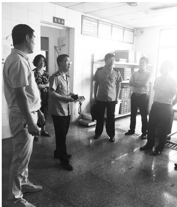
6月2日,市场监管局工作人员对长乐中学高考考点进行食品安全专项检查。

【保障考试点食品安全】 4月8日至10日,市场监管局对全市7个学考选考考点及周边食品经营单位、4家校园食品配送企业进行食品安全检查,考试期间未发生一起食品安全事件,保障了6996名考生的饮食就餐安全。5月31日至6月17日期间,市场监管局对8个高考考点、13个中考考点学校食堂、超市及周边食品安全单位进行动态安全监管,对10014名考生的就餐安全提供保障。