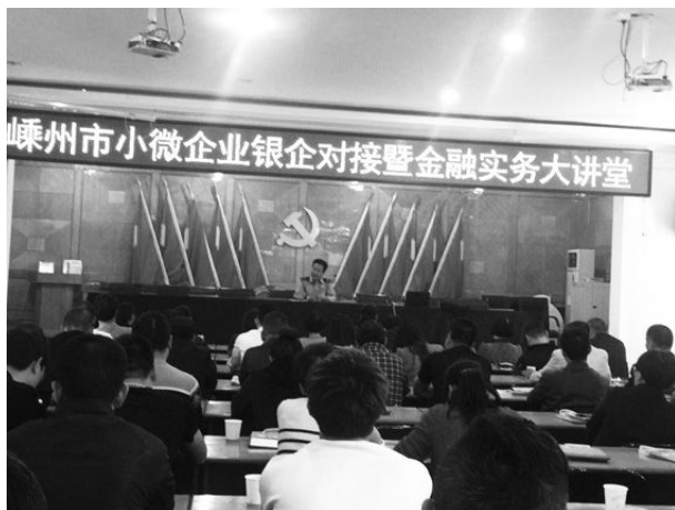
11月2日,市场监管局市民个人协会举办小微企业银企对接暨金融实务大讲堂。

【破解融资难】 9月15日,市场监督管理局、市民个协会会同建设银行嵊州支行在三界镇镇政府会议室举办“嵊州市千家小微企业银企对接活动(三界站)启动仪式”,辖区近100家小微企业参加。市民个协会同建设银行嵊州支行签订了《金融服务协作备忘录》,确定双方互为战略合作伙伴,商定在符合相关政策前提下,建行承诺3年内(2019年12月止)对三界镇小微企业给予8千万元的授信额度。11月2日,市场监管局、市民个协会在黄泽镇镇政府会议室举行嵊州市小微企业银企对接暨金融实务大讲堂,来自黄泽镇、金庭镇、北漳镇近120家小微企业业主参加。中信银行推出了“房产押”“综合授信”“流动性担当”等多款金融产品。当场就达成授信意向8家,授信金额135万元。同时向与会的每一家企业发放了资金需求调查表,详细了解企业具体的资金需求。深受广大小微企业业主的欢迎。