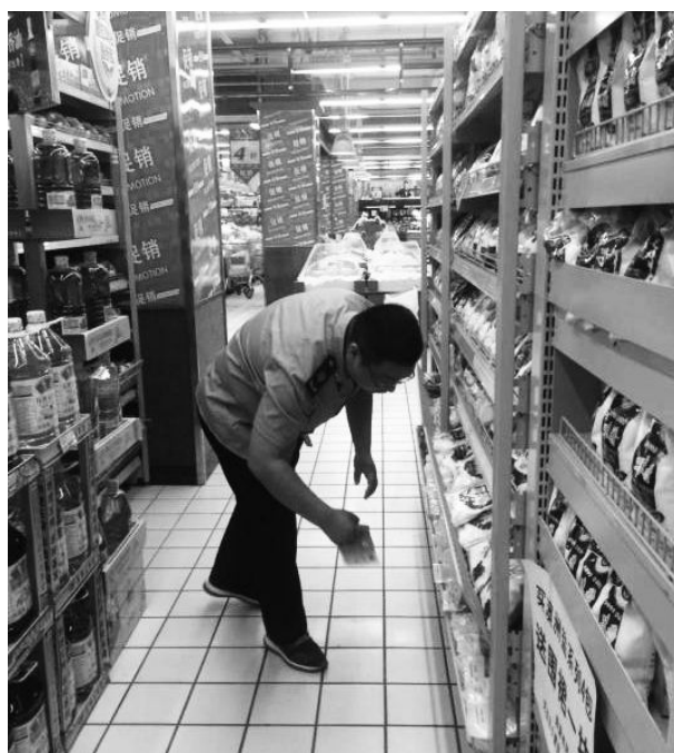
5月,市场监管局工作人员对新国商商场食盐进行检查。

商标名为“代盐人”的深井岩盐(加碘)存在“脚臭味”的问题,市场监管局执法人员对辖区内各大农贸市场、购物超市、粮油副食、小食品店等经营单位进行全面排查,主要检查经营单位在售盐的供货商资质、进货票据及台账记录情况,重点查看是否存在销售河南省平顶山神鹰盐业有限责任公司生产的食盐。同时要求经营单位负责人强化主体责任意识,严格落实进货查验、索证索票制度,一定要从正规渠道购进食盐,确保消费者的用盐安全。检查经营户1000余家,尚未发现有“脚臭盐”流入嵊州。