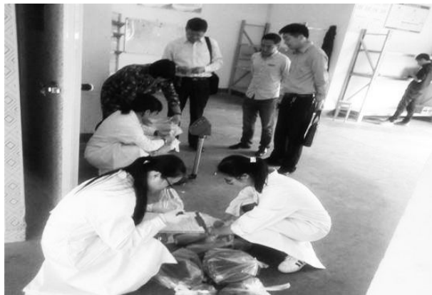
3月13日,市场监管工作人员现场抽检百乡缘农业发展有限公司配送食品情况。

【技术监管校园食品配送企业】 3月,市场监督管理局联合市食品药品检测检验中心工作人员前往百乡缘、亿尔达、浙农茂阳等3家校园食品配送企业,通过进货查验制度落实与食品检测的技术手段,提高校园食品配送企业的食品安全风险意识和食品安全管理水平。一是随机抽查5批次食品,倒查供货商许可证、合格证明文件与供货发票情况。二是对3家企业自设的快速定性实验室是否正常运行进行实地检查,查看检测室的台帐,抽查留样柜,查验检测试剂的使用情况,由检测中心的技术人员对发现的问题进行现场汇总和指导。三是抽检食用农产品68批次。对每家企业配送的食用农产品随机抽取20个批次以上进行定量检测,以技术检测手段提升监管权威。