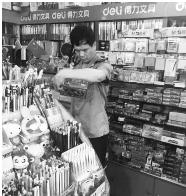
6月21日,市场监管局执法人员检查剡山小学周边文具店。

【首张多证合一营业执照】 7月3日,市匠子电器有限公司法定代表人,在行政服务中心市场监管窗口领取包含住房公积金缴存登记和大学生创业企业认定备案的营业执照,为嵊州颁发的首张“多证合一、一照一码”营业执照。8月22日,市蜜糖罐服装店经营者在行政服务中心市场监管窗口领取纸质营业执照,并手机下载了电子营业执照。为嵊州颁发的第一张全程电子化营业执照。9