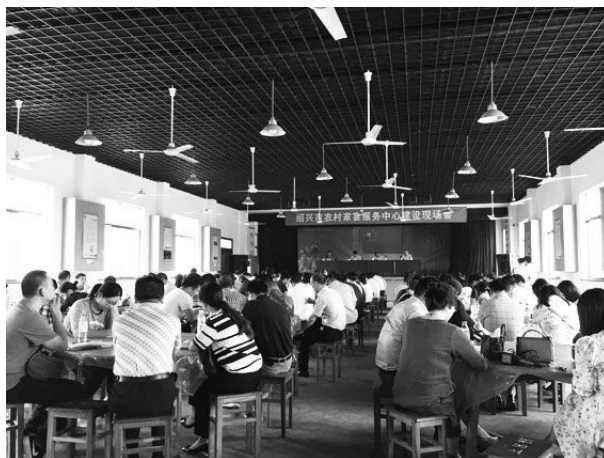
5月25日,绍兴市家宴现场会在南田村召开。

务中心、鹿山街道南田村家宴服务中心,感受农村家宴中心建设成效。随后,在南田村召开家宴服务中心建设现场会。