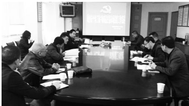
4月11日,“互查互学互促”检查组在市场监管局召开座谈会。

典型培育情况等方面,对全市个体工商户和商品交易市场党建工作进行全方位的考查,检查组对考察结果给予高度肯定。