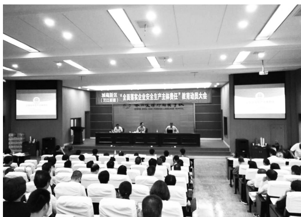
6月13日上午,城南新区(三江街道)在爱德外国语学校体育馆报告厅召开“全面落实企业安全生产主体责任”教育动员大会。

【落实主体责任】 制定了《嵊州市 2017 年度生产经营企业履行安全生产主体责任正负面清单》,督促主体责任落实。推进企业安全生产标准化创建工作。完成标准化创建 649 家,正在创建 35 家。积极推进小微企业社会化服务工作。通过对企业的生产经营场所进行排查巡查督查等手段,督促其履行主体责任。全年共督促企业内部签订生产安全责任书 24855 份;督促 728 个企业健全完善安全生产规章制度及安全操作规程;督促企业整改生产设备设施场所安全隐患 2621 处;督促企业落实现场安全管理人员 458 人;督促 114 家企业完成职业病危害项目申报;督促 143 家企业进行职业健康检查 4350 人次。通过督促整改,使企业真正承担起主体责任,落实安全生产防控措施,提高了企业自身安全防控能力。(赵琴)