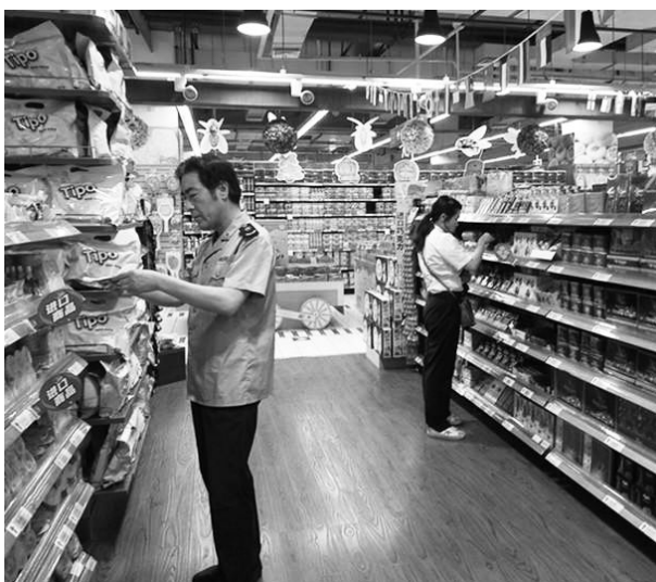
6月2日,市场监管局工作人员在世纪联合商场检查进口食品。

【检查进口食品】 6月2日,市场监管局会同绍兴市商检局嵊新办事处工作人员检查市商场超市的进口食品的经营情况。重点是是否有商检部门发的《入境货物检验检疫证明》,预包装食品是否