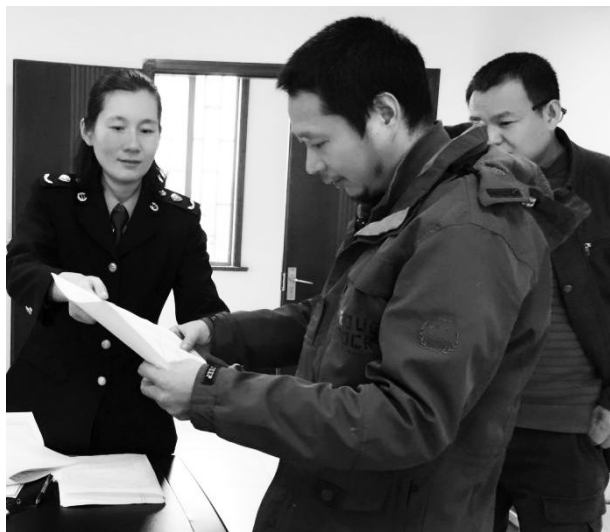
10月底,市场监管局工作人员为根雕大师提供“上门送照”服务。

得知艺术村的根雕大师们要把工作室搬迁至文化创意产业园,就主动与领尚小镇建设指挥部、艺术村办公室对接,通过远程指导、上门服务、加班加点等方式,在短短几天内就办理了48本营业执照,其