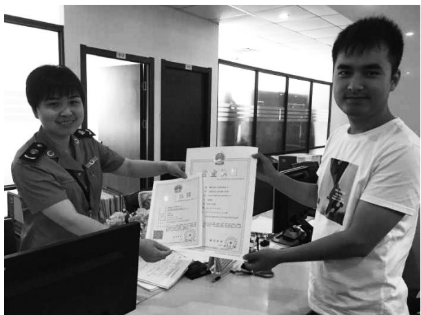
7月3日,市场监管局工作人员在行政窗口向市匠子电器有限公司法定代表人颁发首张“多证合一、一照一码”营业执照。

【首张多证合一营业执照】 7月3日,市匠子电器有限公司法定代表人,在行政服务中心市场监管窗口领取包含住房公积金缴存登记和大学生创业企业认定备案的营业执照,为嵊州颁发的首张“多证合一、一照一码”营业执照。8月22日,市蜜糖罐服装店经营者在行政服务中心市场监管窗口领取纸质营业执照,并手机下载了电子营业执照。为嵊州颁发的第一张全程电子化营业执照。9