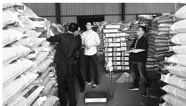
3月17日,市质监局稽查大队赴市农资配送中心开展“蓝剑2号”农资专项执法打假系列行动。

【执法打假】 开展以农资、特种设备、儿童服装、家电、建材等产品为重点的“蓝剑”系列专项执法行动,全年共出动执法人员1080人次,检查生产企业、经营单位360家次,查处违法行为81起,立案案件69件,现场处罚案件12件,其中万元以上案件57件,到位罚没款190.7万元。