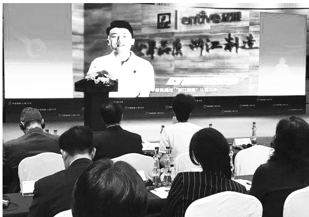
9 月 15 日,在中国质量(上海)大会上播放市亿田电器通过“浙江制造”认证后创新发展的专题片。

【浙江制造】 按照 3 年培育计划,推进培育工作。打造企业标杆,新增“浙江制造”认证企业 1 家和产品认证证书 6 张,为主起草“浙江制造”团体标准 1 项,参与制定“浙江制造”团体标准 3 项。鼓励浙江制造认证企业参加“品字标”浙江制造公益广告投放、主题活动、征文及多平台整合传播活动。9 月,《人民日报》、新华社、《经济日报》等多家央视媒体来嵊宣传报道厨具产业“浙江制造”试点工作。9 月 15 日,在中国质量(上海)大会上播放了亿田